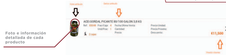
Foto e información detallada de cada producto